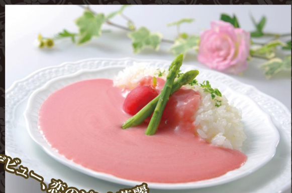
華麗にデビュー、恋のピンク華麗

Unbelievable color but real curry taste! Original product from Tottori prefecture. The pink natural colorant is from Tottori-grown red beets. Great as Tottori souvenir!